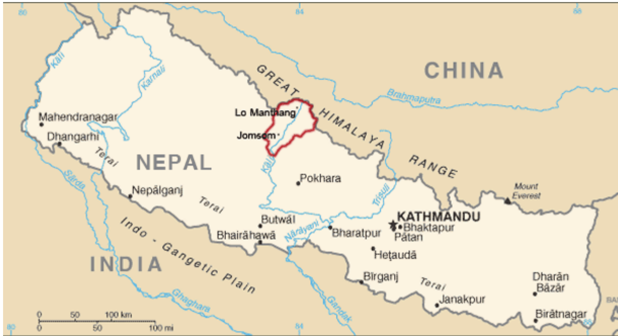
MUSTANG ANTICHI MONASTERI SULL'ALTOPIANO, 3500 MT